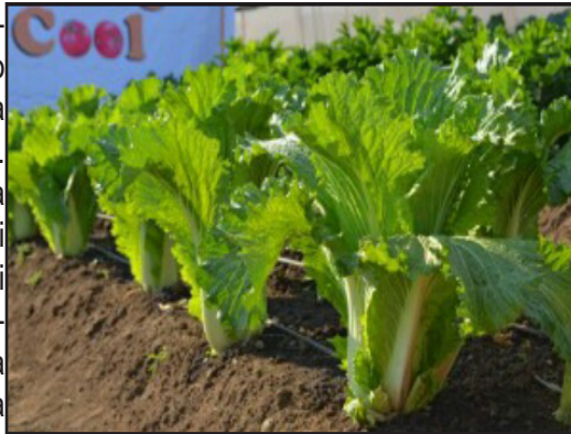
Kilimo cha Mbogamboga kwakutumia njia za kisasa

pata haja kubwa kwa wingi. Msomaji wa makala hii nakushauri sana utumie mboga hii ya mchicha kwa ajili ya kuimarisha afya yako ili uweze kuwa mtu makini katika taifa hili, pia tutunze vizuri ardhi yetu na vyanzo vya maji kwa ajili ya kuweza kustawisha mboga zilizo bora kwa manufaa ya watu walio sasa na baadae hiko ndicho kilimo cha mchicha hiyo ndiyo mboga bora kwa mwanadamu.