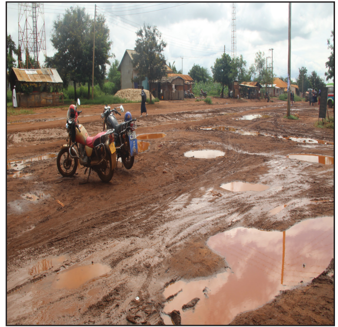
Barabara ya Nanenane Morogoro iliyo-haribiwa na mvua