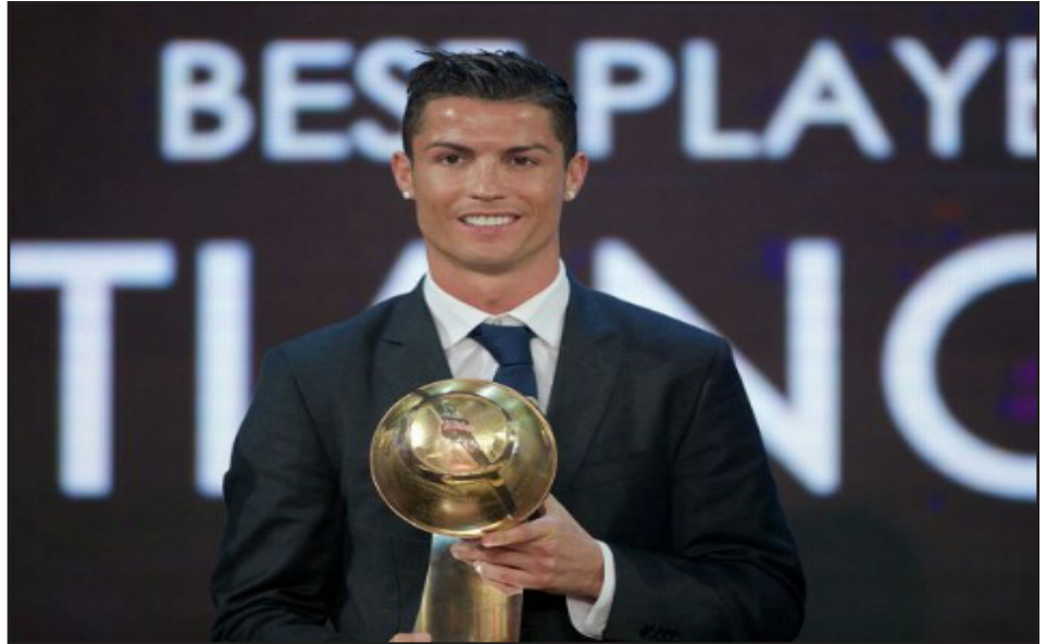
Mchezaji wa Real Madrid Christian Ronaldo akiwa na tuzo ya mchezaji bora wa dunia

Kocha mkuu wa kikosi cha Real Madrid amesema mchezaji wa kikosi chake Christian Ronaldo anasitahili kuchukua tuzo ya mchezaji bora wa dunia wa mwaka msimu wa 2017-2018 kutokana na kiwango bora anacho kionesha sasaivi.