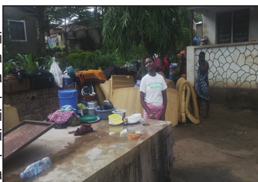
Wanabweni wakiwa katika hali ya fura baada yakupata maji