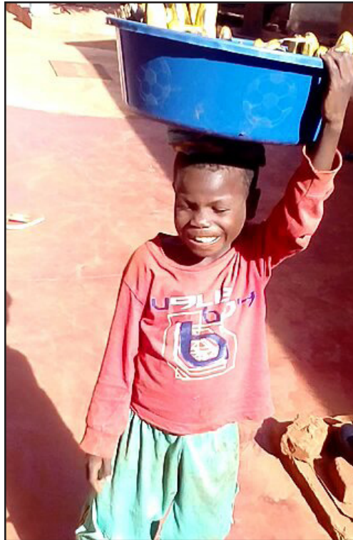
Mtoto akiwa anafanya biashara

Pamoja na hayo wadau wa elimu wameonesha kukerwa, hivyo kukemea vitendo hivyo na kuongeza kuwa mtoto anapaswa kupata mahitaji yake yote ya msingi hasa elimu