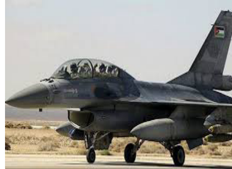
Ndege ya kivita ikijiandaa kuruka

Ndege mbili za kijeshi za China zimezuia 'vibaya' ndege ya Marekani kulingana na jeshi la Marekani.