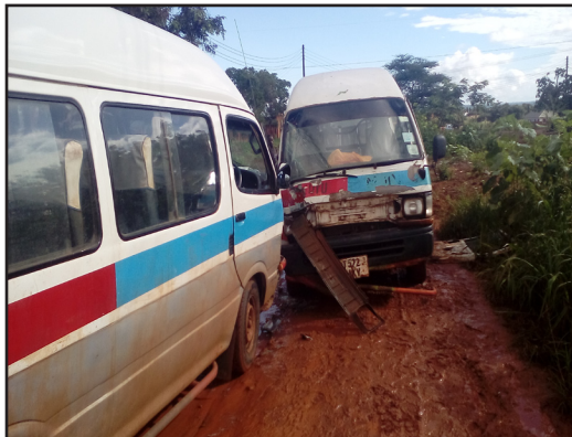
Mabasi madogo aina ya Hiace yaliyopata ajali eneo la Nanenane picha na Zaituni

Wakiongea na Msj weekly katika nyakati tofauti abilia waliokuwa wakisafiri wamesema chanzo cha ajari hiyo ni Mvua kubwa zinazoendelea kunyeshwa na kuongeza kuwa uchakavu wa barabara ndio hasa uliochanigia kwa kiasi kikubwa kutokea kwa ajari hiyo na barabara kuwa finyu hivyo