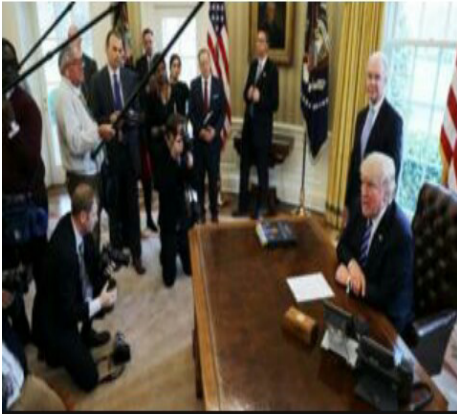
Rais wa marekani Mh.Donald Trump akizungumza na waandishi wa habari

Rais Donald Trump wamarekani amelegeza vikwazo dhidi ya Iran kutokana na mpango wake wanyuklia tofauti na msimamo wakati wa kampeni.