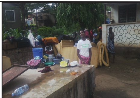
Wanabweni wakiwa katika hali ya furaa baada yakupata maji

Na:Emilia Mandaki Wanafunzi wa chuo cha uandishi wa habari Morogoro (MSJ) wanaoishi katika hosteli za chuo hicho wameondokana na shida ya maji ambayo imekuwa ikiwakabili kwa muda