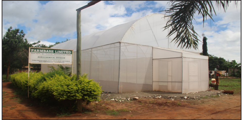
Moja ya vitalu vya kuandalia miche ya mbogamboga za majani, kwa jina maarufu 'Green house'

Bw. Mwenyekida aliendelea kusema kuwa wanaipongeza serikali ambayo inaendelea kuwapa sapoti na mchango mkubwa wa viwanja na kuwafanya waendeleo kufanya kazi zao vizuri. Akitaja faida amesema kuwa kutokana na kupata wateja wengi wakati