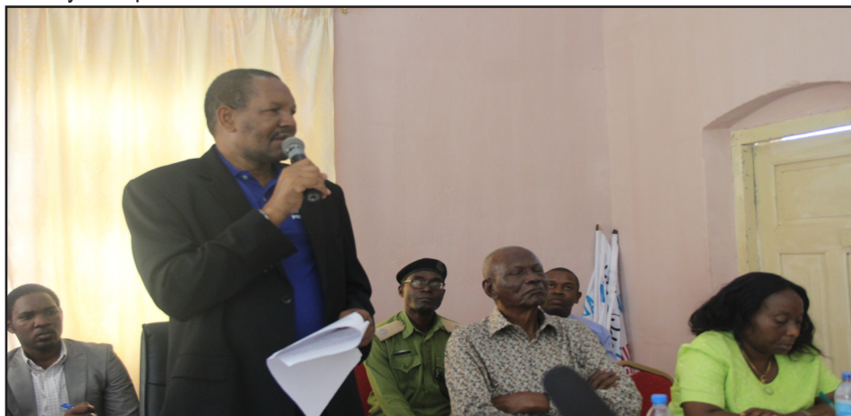
Mkuu wa mkoa Mh.Kebwe S.Kebwe akiutubia siku ya uhuru wa vyombo vya habari picha na Yasinta Maarifa. Watu 2 wajeruiwa katika ajali picha na Yasinta Maarifa

Mkuu huyo ndipo alisimama na kuwashukuru kwa taarifa hiyo na ku-