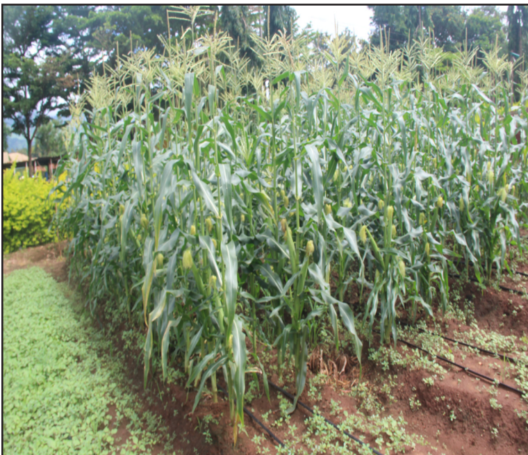
Kitalu cha mahindi ya kisasa kilichopo katika viwanja vya maonesho ya Nanenane Morogoro.