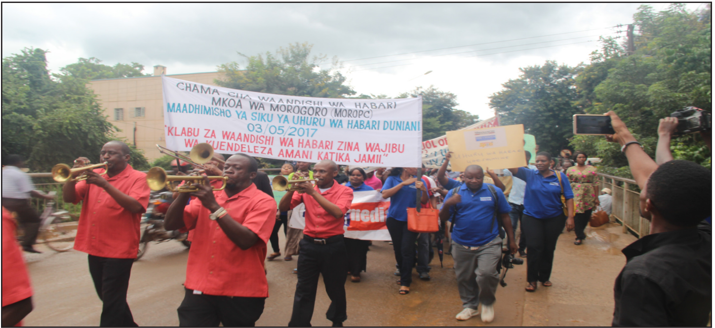
Baadhi ya waandishi wa habari wakiwa katika maandamano siku ya uhuru wa nyombo vya habari Mkoani Morogoro.